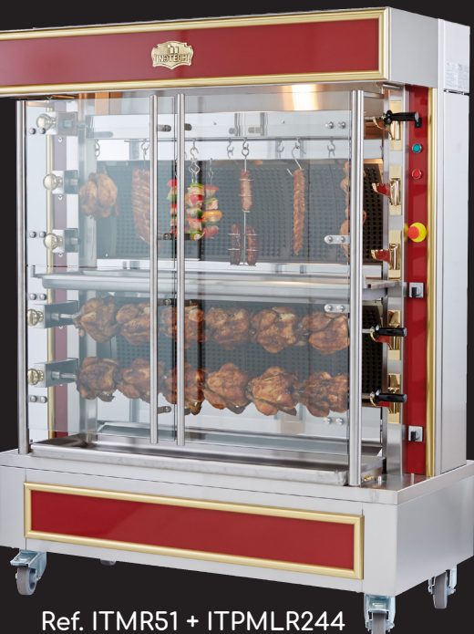
Ref. ITMR51 + ITPMLR244