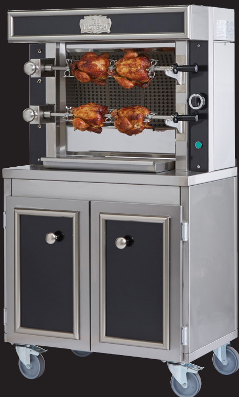
Ref. ITNR2 + ITPNR390