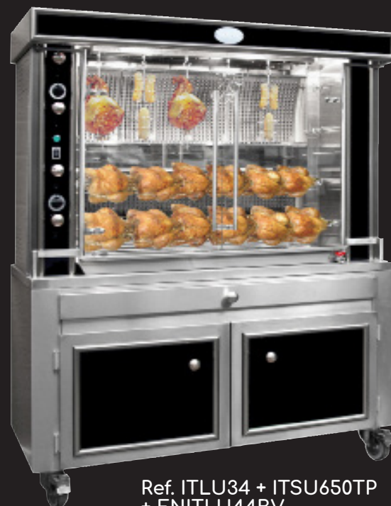
Ref. ITLU34 + ITSU650TP + ENITLU44BV